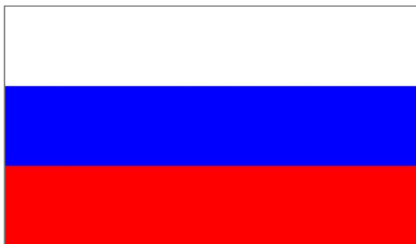
Государственный флаг РФ