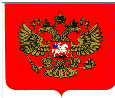
Государственный герб РФ